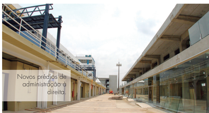
Novos prédios de administração à direita.