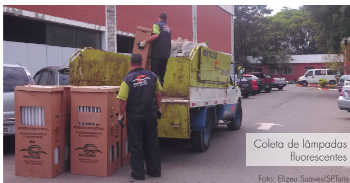
Coleta de lâmpadas fluorescentes