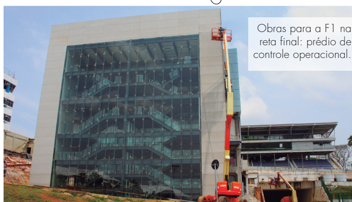
Obras para a F1 na reta final: prédio de controle operacional.